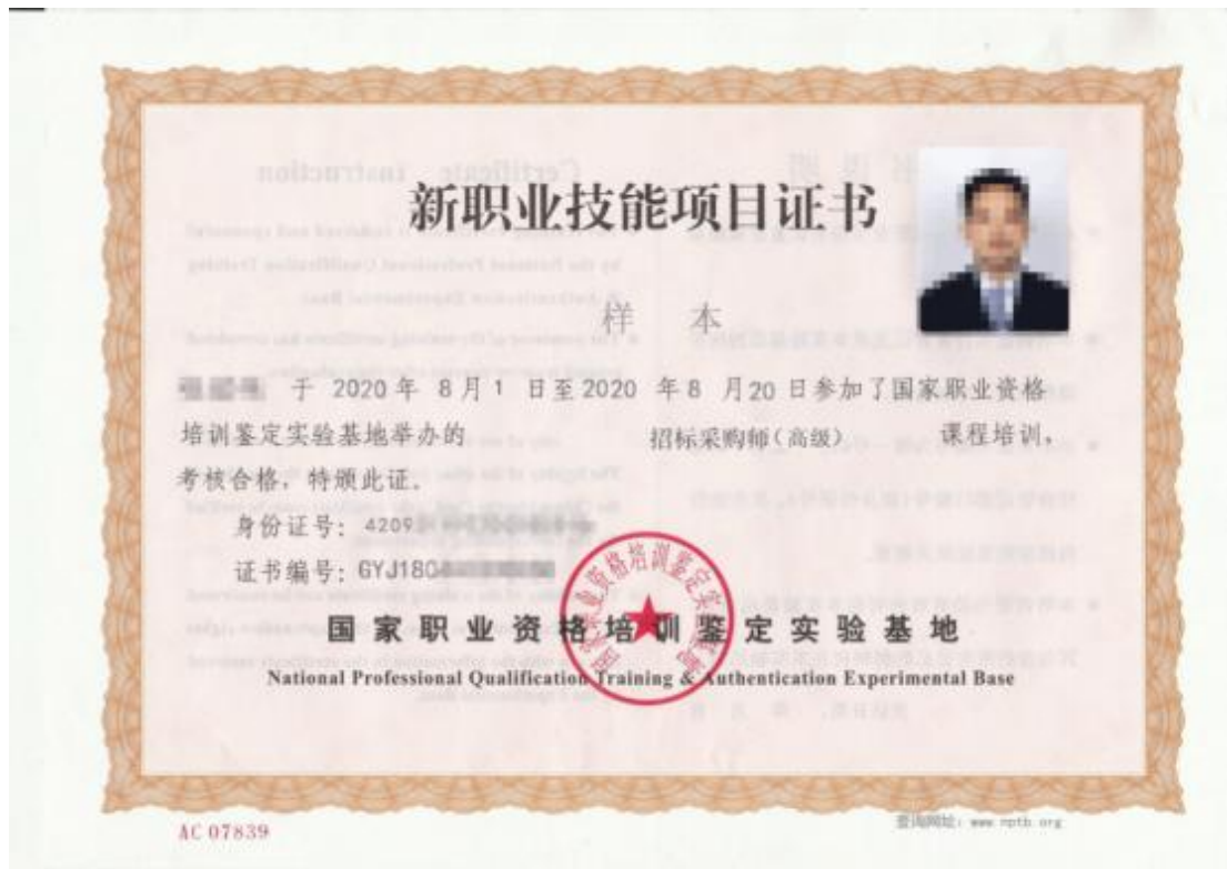
附件 1：招标采购师（高级）样本